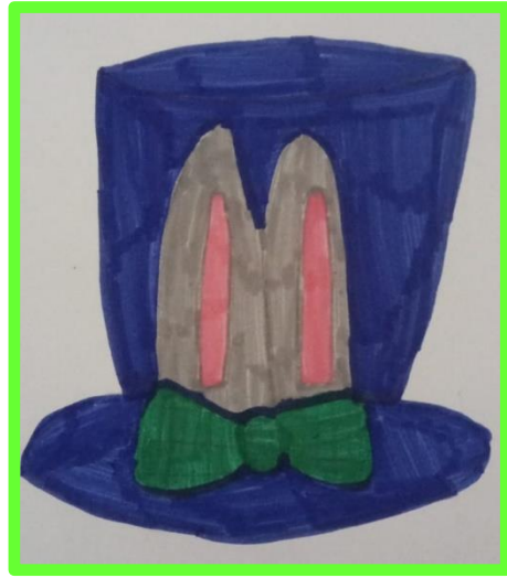
Classe V B R. Scardigno